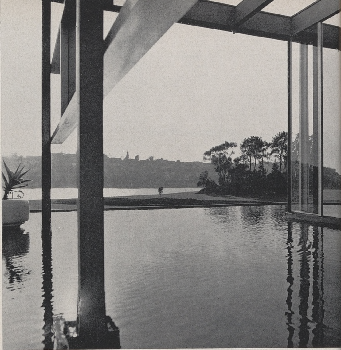
V.D.L. Research House at Silverlake, USA R. J. Neutra, architecte